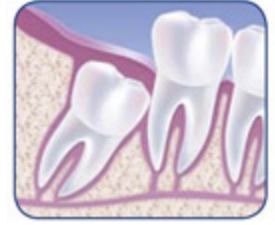
Zurückhalten eines dritten Molaren durch das Weichgewebe (Retention).