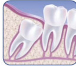
Nicht achsengerechter Verbleib eines dritten Molaren (Weisheitszahns) im Knochen (Impaktion).

In vielen Fällen ist es das Beste, festsitzende Weisheitszähne zu ziehen. Wenn die Lage des Zahns es zulässt, kann die Entfernung eines Weisheitszahns in der Praxis Ihrer Zahnärztin / Ihres Zahnarztes erfolgen.